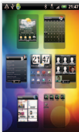
Panel s rýchlym prístupom k siedmim obrazovkám HTC Sense UI