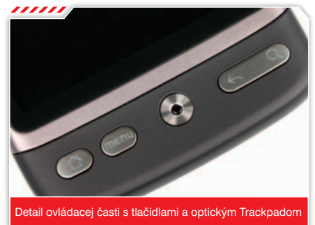
Detail ovládacej časti s tlačidlami a optickým Trackpadom

mienok, v akých fotíte, ale ich kvalita je najmä na displeji telefónu viac ako dobrá. Zaujímavosťou je možnosť nastavenia štandardného alebo širokouhlého formátu fotografií. Fotoaparát ponúka veľké množstvo nastavení konkurujúc aj najlacnejším kompaktom. Nechýbajú scénické režimy, nastavenie citlivosti ISO, vyváženie bielej alebo nastavenie expozície snímky. Samozrejmosťou je možnosť natáčania videa, ktoré môže mať maximálne rozlíšenie 800 x 480 bodov pri 25 fps s kódovaním H.263 alebo MPEG4. Kvalita videa je však priemerná. Na prezeranie snímok a videí je v HTC Desire určená aplikácia Fotografie. Zhotovené zábery sú jednoducho triedené a zoradené do pásu, v ktorom sa pohybujete posunom prstu do strán. Pri otočení zariadenia naležato sa aj fotografia automaticky zväčší na celú obrazovku a vďaka multitouch ovládaniu môžete fotografie zoomovať podľa vašich požiadaviek. K multimediálnym funkciám patrí aj integrované FM rádio s RDS či vynikajúci prehrávač audio súborov doplnený o widget pre rýchle ovládanie práve prehrávanej skladby.