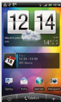
Základná obrazovka HTC Sense UI s hodinami, počasím a skratkami k aplikáciám

poru editácie Office dokumentov bez nutnosti zakúpenia externej aplikácie. Priamo v modeli Desire sa nachádza len prehliadač dokumentov, ale zato veľmi rýchly, bez problémov si poradil aj so zložitejšími dokumentmi.