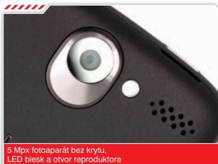
5 Mpx fotoaparát bez krytu, LED blesk a otvor reproduktora