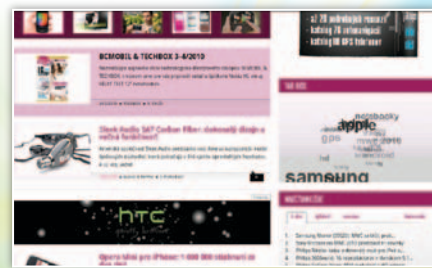
Internetový prehliadač zobrazuje na web stránkach aj flash