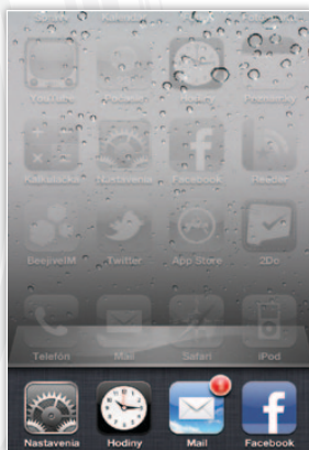
Multitasking poteší určite množstvo užívateľov