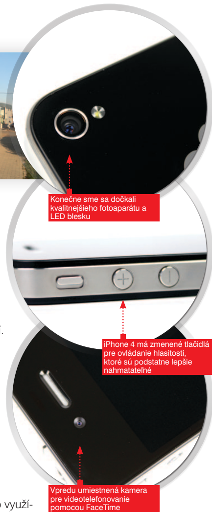
Konečne sme sa dočkali kvalitnejšieho fotoaparátu a LED blesku

Rovnako ako nový iPod Touch je aj iPhone 4 často využívaný na hranie hier. Tých nájdete v App Store neúrekom. Okrem jednoduchých kartových hier je k dispozícii aj množstvo titulov od známych spoločností ako Gameloft alebo EA Games. Hranie hier je vďaka rýchlemu procesoru a jemnému displeju zážitkom. Veľa vývojárov už stihlo svoje aplikácie a hry aktualizovať, aby dokázali využiť potenciál skrytý v RETINA displeji a tým znásobiť vaše potešenie. Tituly, ktoré som si obľúbil na mojom iPhone 3GS, sú na štvorke ešte živšie a zábavnejšie, samozrejmosťou je rýchle spúšťanie jednotlivých hier a aplikácií. Zámerne som sa v článku vyhol vymenovaniu parametrov, ktoré si môžete pozrieť v priloženej tabuľke, ale iPhone 4 zvláda dátové prenosy pomocou rýchlych sietí HSPA, má samozrejme zabudovaný GPS modul a Bluetooth modul, ktorý však bohužiaľ aj naďalej využijete len pre pripojenie handsfree alebo bezdrôtovej klávesnice.