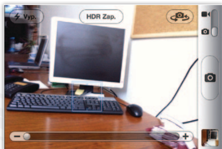
Aplikácia fotoaparát ponúka v iPhone 4 nastavenia blesku fotoaparátu a zapnutie HDR režimu

iPhone 3GS bol často vytkávaný slabší fotoaparát, ktorý len za dobrých svetelných podmienok zvládol vytvoriť veľmi pekné