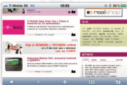
Text internetovej stránky je vďaka RETINA displeju čitateľný aj bez priblíženia