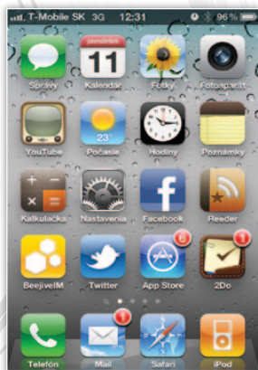
Hlavné menu - ikony sú jasnšie a farby jasnejšie