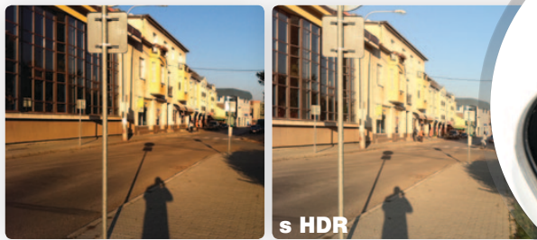
Rozdiel medzi fotografiami s použitím HDR režimu a bez HDR režimu

zábery. Apple teda vypočul prosby užívateľov a v iPhone 4 sa okrem 5 Mpx fotoaparátu nachádza aj malý LED blesk. Nie je to síce xenónový blesk profesionálneho fotoaparátu, ale do vzdialenosti dvoch-troch metrov osvetlí fotený objekt dostatočne. Najnovšia aktualizácia navyše pridala podporu HDR režimu a tak vaše fotografie krajíniek už nebudú mať prepálenú oblohu. Potešením je možnosť natáčania plynulého HD videa, ktoré ho kvalita je veľmi dobrá aj pri umelom osvetlení. V kombinácii s platenou aplikáciou iMovie, ktorú si môžete zakúpiť v App Store, tak budete mať stále so sebou vreckovú HD videokameru a strižňu v jednom.