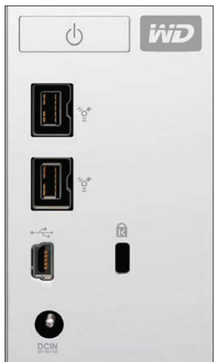
Rozhrania FireWire a USB použité pri modeli WD My Book Studio

Aj napriek avizovanému uvedeniu rozhrania USB 3.0 mnohí výrobcovia stále o novom štandarde nie sú presvedčení. Pravdupovediac, podľa našich testov v minulosti ani my nie sme. To je aj dôvod, prečo majoritné portfólio tvoria modely s pripojením cez rozhrania USB alebo eSATA. Podľa nášho názoru sa situácia zmení v priebehu tohto roka. Výrobcovia čipov a základných dosiek pripravujú kvalitnejšie radiče a USB 3.0 sa stane bez problémov použiteľným a masovým rozhraním. Dobrá správa pre používateľov: Trh s externými pevnými diskami nie je ani zďaleka naplnený, budú pribúdať nové modely obsahujúce viac ako jedno rozhranie na prepojenie s počítačom a výrobcovia sa vydajú na cestu zlepšovania užitočnej hodnoty týchto zariadení. Už nepôjde len o obal s pevným diskom a radičom. Vidieť to napríklad na modeli WD My Book Studio a integrácii displeja založeného na technológii e-papiera.