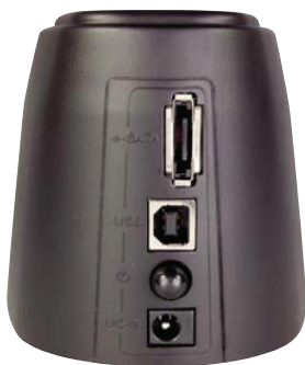
Konektor eSATA (vyššie) a USB (nižšie)

V skutočnosti každý disk je kompatibilný so zálohovacím nástrojom,