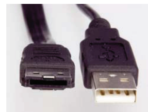
Káble na pripojenie eSATA a USB

Iná situácia je pri 3,5-palcových modeloch, ktoré majú rozhranie eSATA. Tu sa oplatí zvážiť použitie modelu s rýchlosťou 7200 ot./min, aj keď to nepovažujeme za vyslovenú prioritu. Tou bude pre mnohých práve kapacita disku a dizajn. Netreba sa obávať o kompatibilitu, keďže externé disky s rozhraním eSATA vždy majú aj konektor USB. Ľahko ich pripojíte aj k počítaču bez tohto konektora, hoci za cenu zníženého výkonu.